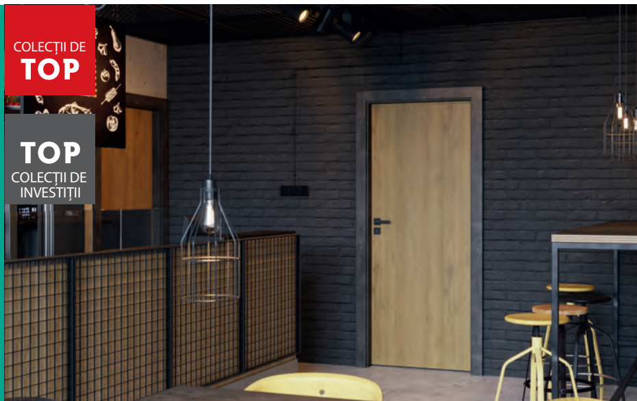
Laminate CPL 1.1, ușă - Stejar Natural, toc - Ciment Închis