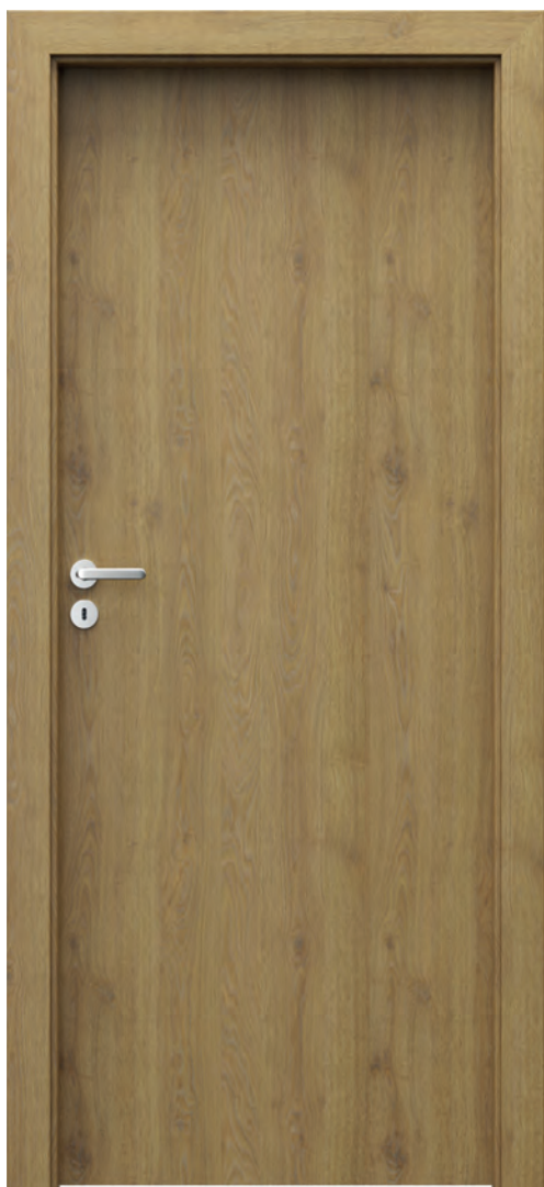
Laminate CPL 1.1, Stejar Natural