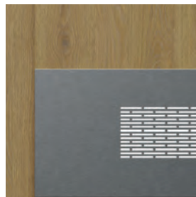
panou inferior de ventilație