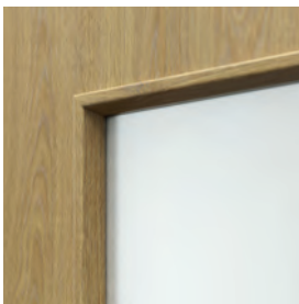
ramă cu sticlă

Verificați posibilitatea de a comanda alte modele prin intermediul comenzilor non-standard, vezi pag. 233.