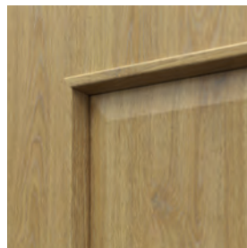
ramă cu panou